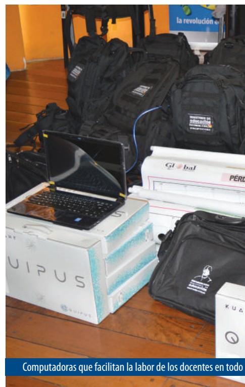
Computadoras que facilitan la labor de los docentes en todo

Una de las prioridades del Ministerio de Educación desde que asumió el cargo el ministro Roberto Aguilar Gómez fue la formación de los maestros del SEP. Por esa razón se implementaron programas de formación continua y complementaria de maestras y maestros del Sistema Educativo Plurinacional, para conseguir a futuro una mejor formación académica del plantel docente de los centros educativos. Estos programas fueron implementados en diferentes áreas. En uso básico de tecnologías de información y comunicación (TIC) participaron 158.214 maestros de los 9 departamentos.