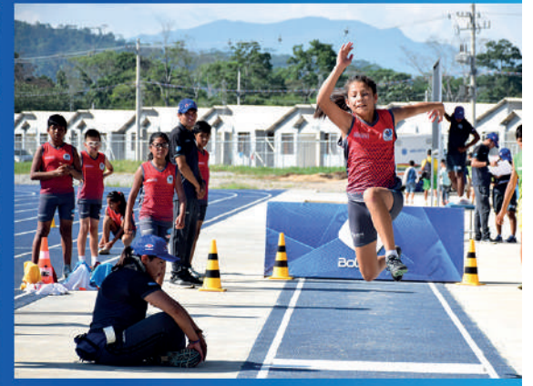
Vinculando la educación y el deporte