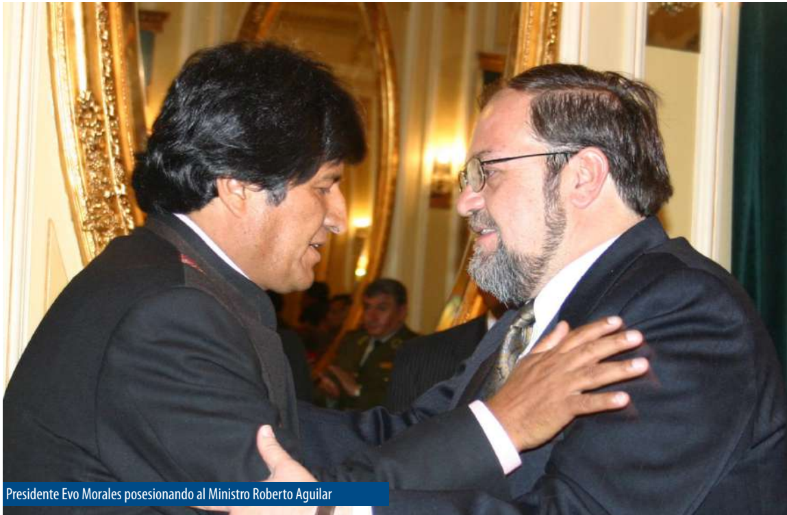
Presidente Evo Morales posesionando al Ministro Roberto Aguilar

Roberto Aguilar, desempeñó funciones como docente universitario por un período de 20 años. Es de profesión economista y fruto de esa carrera, llegó al rectorado de la Universidad Mayor de San Andrés (UMSA). Posteriormente, ocupó el cargo de vicepresidente de la Asamblea Constituyente (2006-2007). Es una autoridad vinculada al ámbito educativo que ahora apoya al país desde el Ministerio de educación.