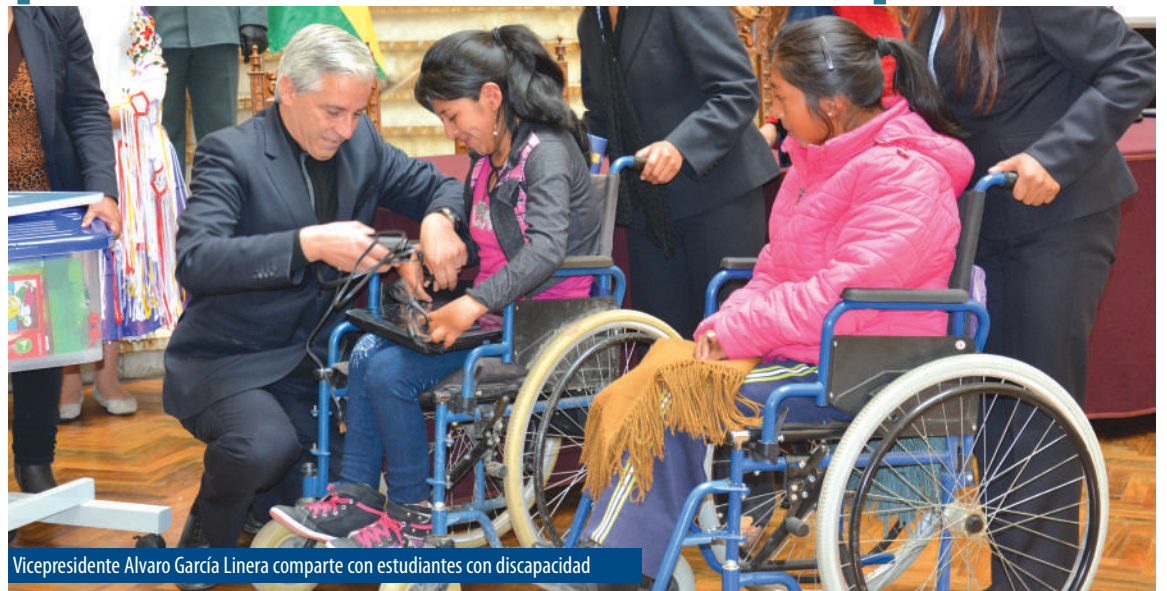
Vicepresidente Alvaro García Linera comparte con estudiantes con discapacidad

Este programa se inició con el objeto de brindar educación a todas las personas con estos grados de discapacidad, bajo los principios de la educación inclusiva para brindar una enseñanza integral. El Ministerio de Educación asume esta tarea luego de que en gobiernos anteriores esta población era invisibilizada. Por tratarse de un servicio voluntario y no remunerado, el Decreto Supremo N° 2950 reglamentado a través de la Resolución Ministerial No. 0177/2017 garantiza a las maestras y maestros participantes del programa "Educación Sociocomunitaria en Casa para Personas con Discapacidad" optar a uno de los siguientes incentivos: 1. Un (1) año de Servicio en Provincia para el Escalafón Nacional, acumulativos hasta un máximo de dos (2) años. 2. Un (1) año de Servicio para Ascenso de Categoría que corresponda al Escalafón Nacional, por única vez.