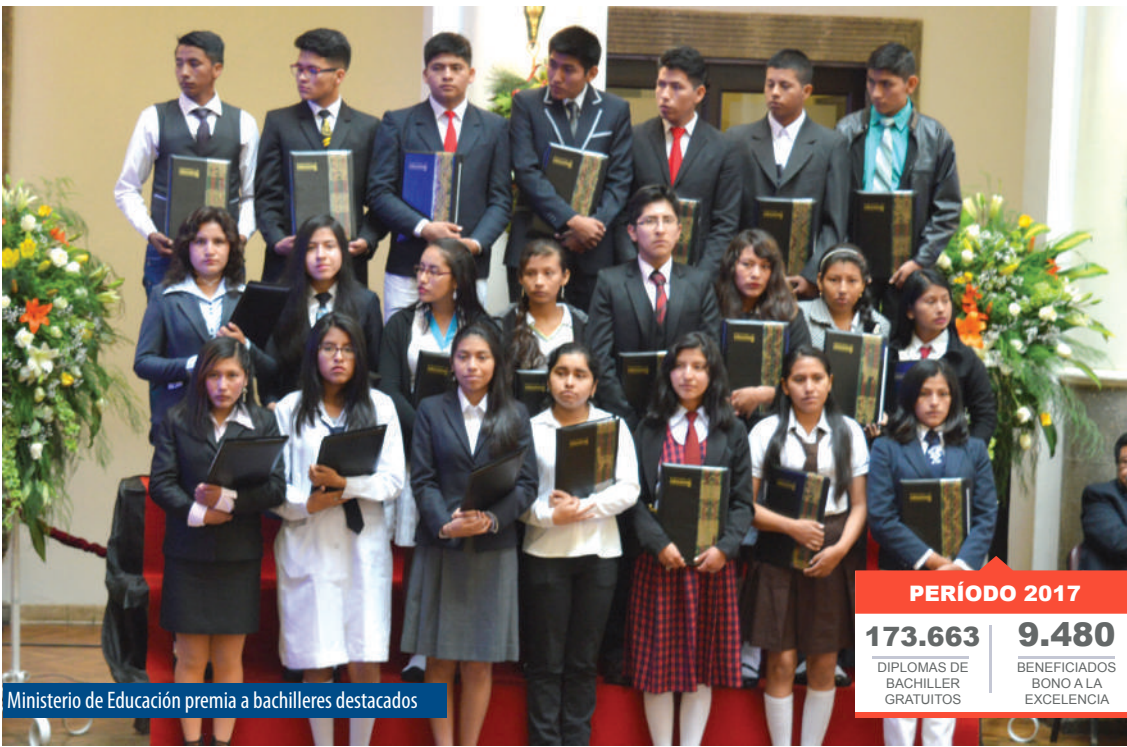
Ministerio de Educación premia a bachilleres destacados

Hasta la fecha 193.921 estudiantes de todo el territorio nacional recibieron gratuitamente su Diploma de Bachiller para seguir una carrera en el nivel superior.