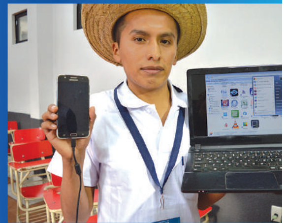
Promoviendo el uso de la tecnología