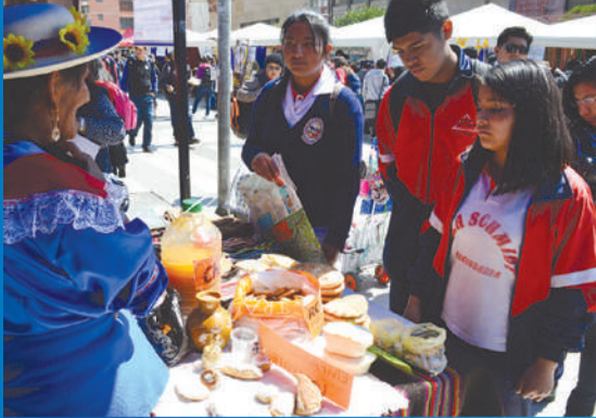
Rescatando los saberes y conocimientos