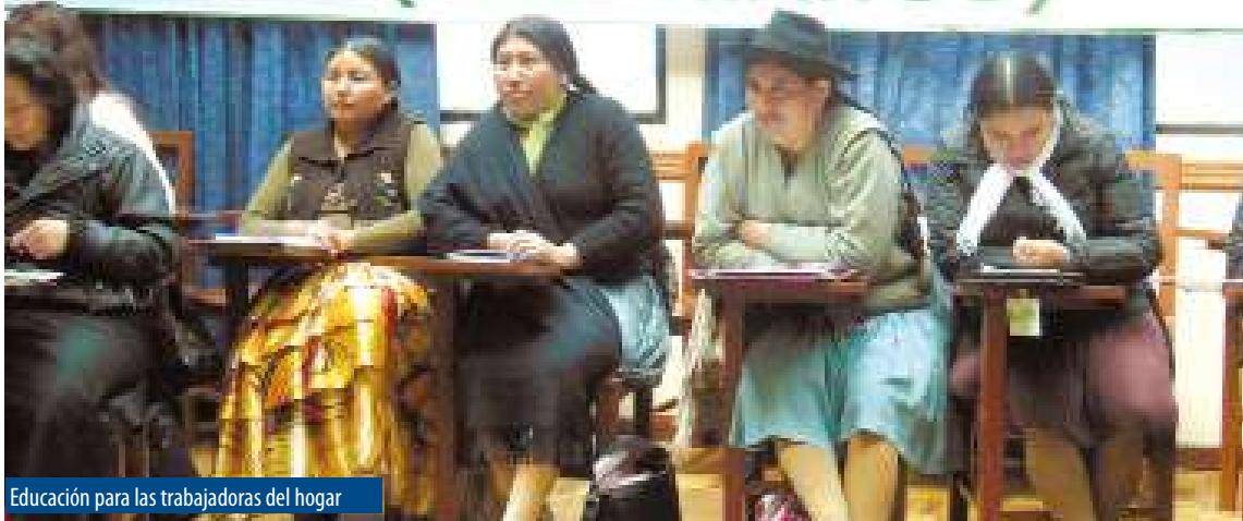
Educación para las trabajadoras del hogar

El Viceministerio de Educación Alternativa y Especial, a través de la Dirección General de Educación de Adultos - DGEA, desde la gestión 2014 lleva adelante el Programa de Formación para Trabajadoras Asalariadas del Hogar a nivel de Bachillerato Humanístico, reconocida legalmente con la Resolución Ministerial N° 308/2014. La iniciativa de este programa data desde la gestión 2012, cuando la Federación Nacional de Trabajadoras del Hogar de Bolivia (FENATRAHOB) presenta una solicitud al Viceministerio de Educación Alternativa y Especial para la apertura de un programa de bachillerato destinado al sector. Los procesos educativos para esta población