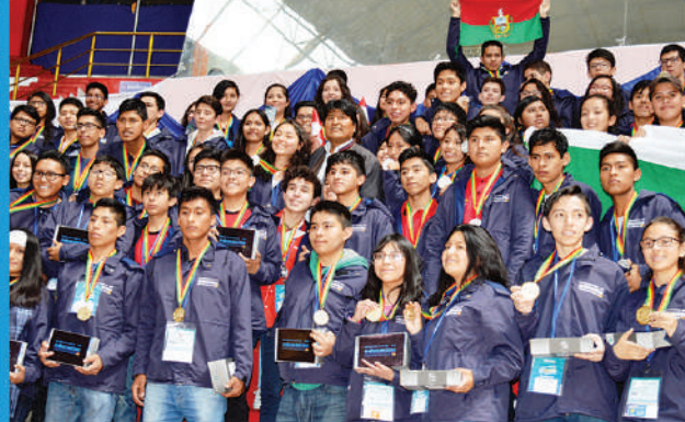
Promoviendo Olimpiadas Científicas Estudiantiles