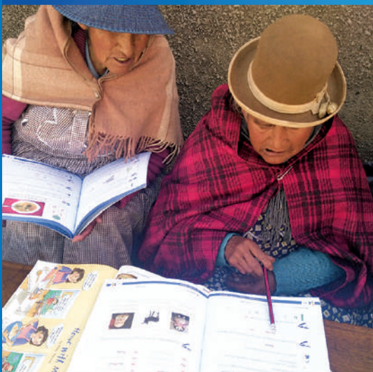
Postalfabetización para nuestros abuelos