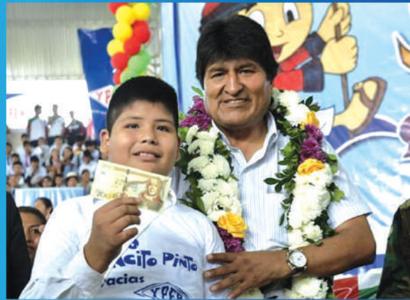
Garantizando el Bono Juancito Pinto