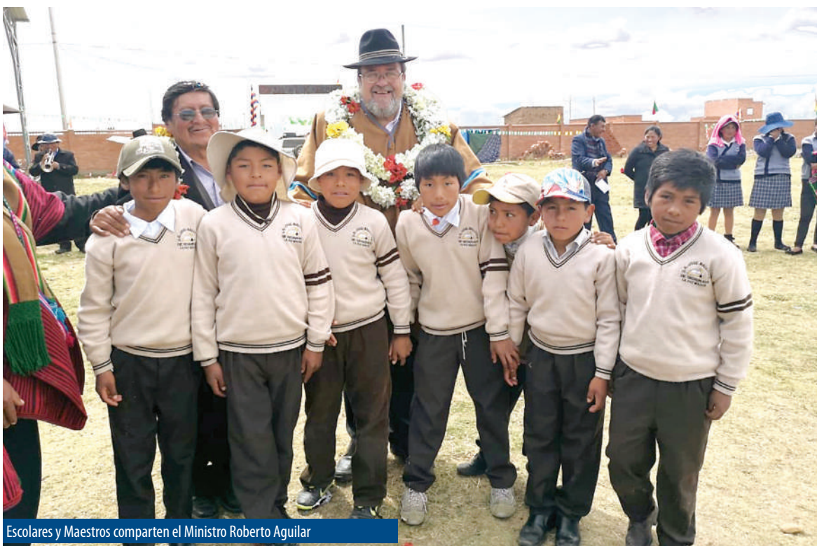
Escolares y Maestros comparten el Ministro Roberto Aguilar

Además porque trabaja por lograr una educación unitaria, pública, universal, democrática, participativa, comunitaria, descolonizadora y de calidad de la mano de todos los sectores educativos.