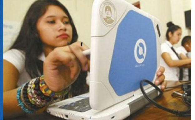
Garantizando computadoras para secundaria