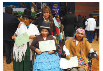
Logros educativos de 11 años de gestión.