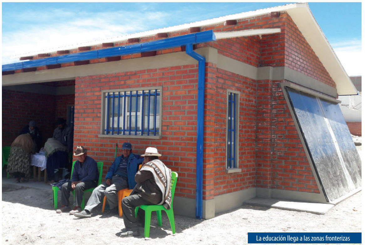
La educación llega a las zonas fronterizas

En el marco de esta misma política se trabaja también con las escuelas liberadoras. Otro de los programas que avanza satisfactoriamente es la formación técnica productiva en zonas fronterizas dirigida a personas jóvenes y adultas mayores de 15 que por limitaciones de tiempo o por encontrarse geográficamente distantes no acceden a oportunidades educativas. En convenio con la Aduana Nacional de Bolivia, uno de los cursos que se imparte en los últimos años en cinco departamentos, es el de la "Función Pública Aduanera" a nivel técnico básico.