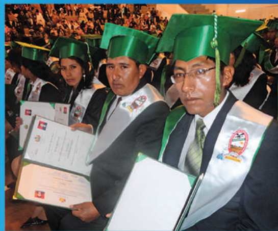
Apostando por la formación docente