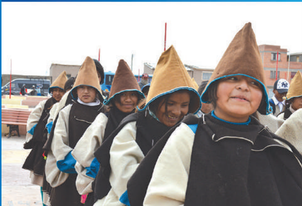
Trabajando por los Pueblos Indígenas