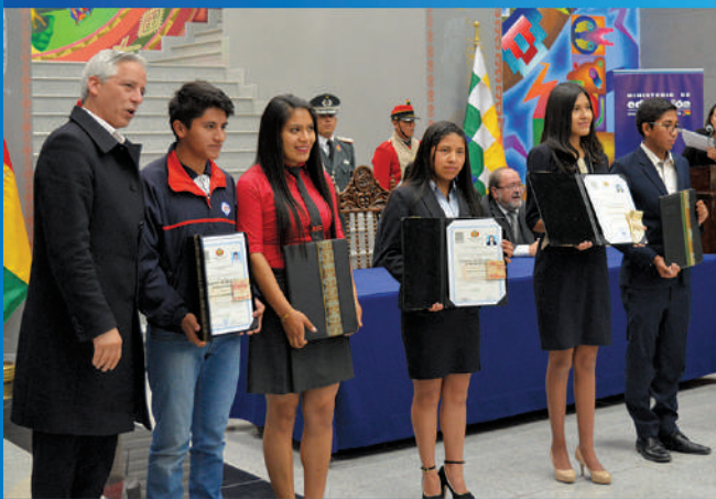
Reconociendo el esfuerzo de los mejores bachilleres