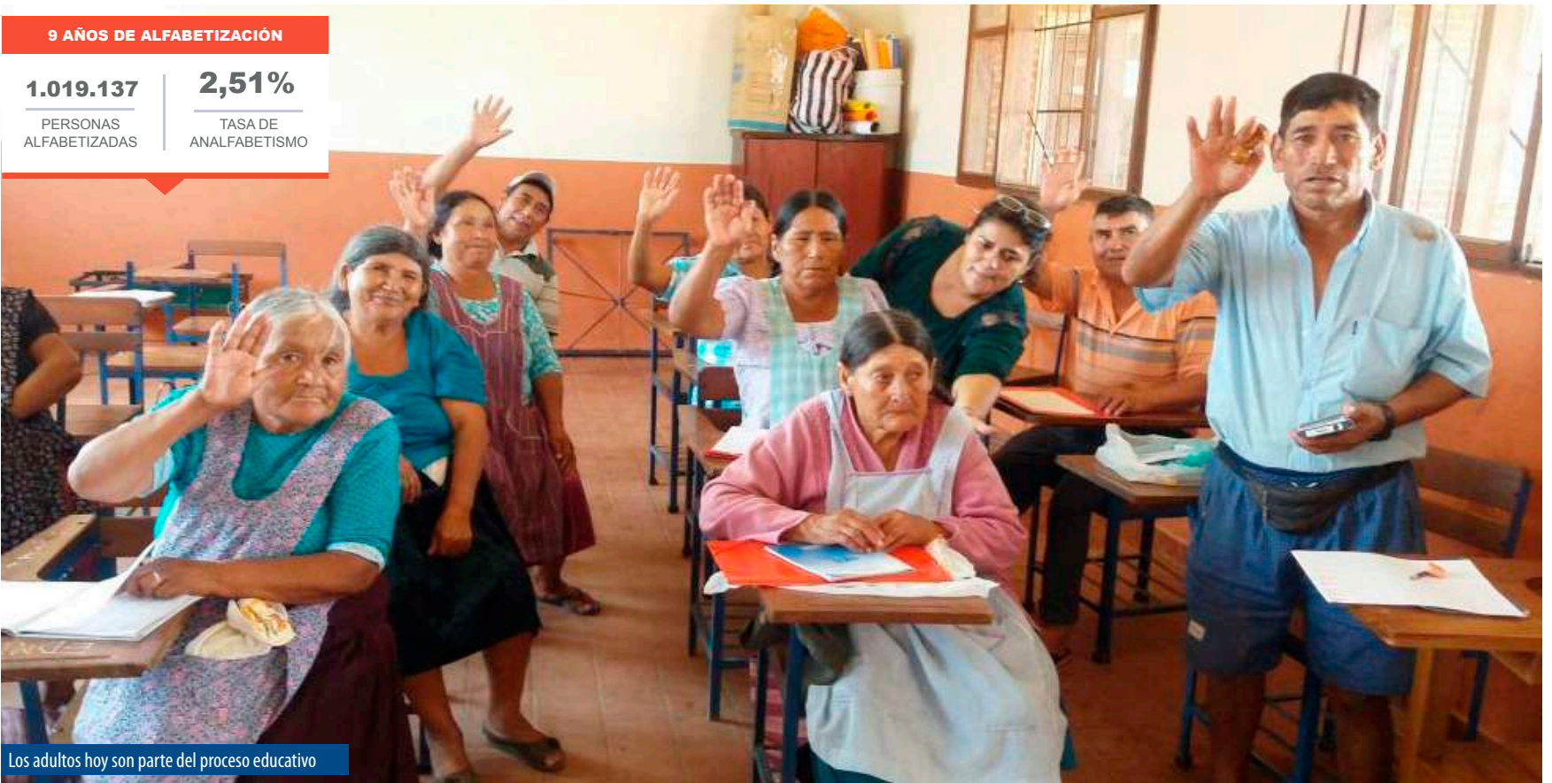
Los adultos hoy son parte del proceso educativo