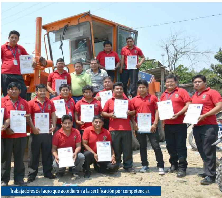
Trabajadores del agro que accedieron a la certificación por competencias

Otro de los pilares de la Revolución Educativa está fincado en el reconocimiento de conocimientos y habilidades adquiridas por los ciudadanos a lo largo de la vida.