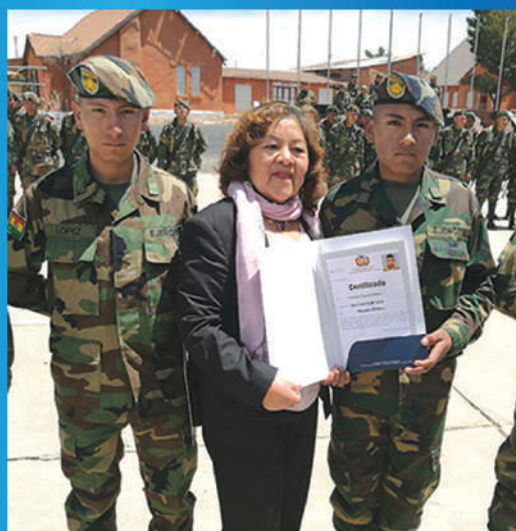
Reconociendo el trabajo y estudio