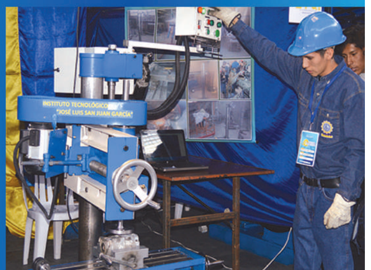
Impulsando la formación técnica