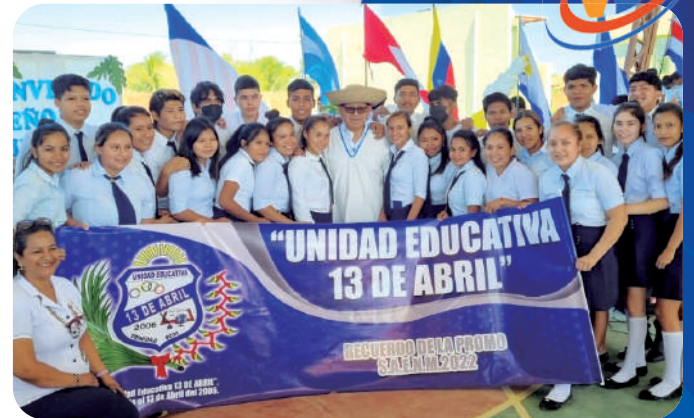
Maestros y estudiantes de la Unidad Educativa "13 de Abril", ubicada en el departamento de Beni, recibieron con cariño la visita del ministro de Educación, Edgar Pary Chambi.