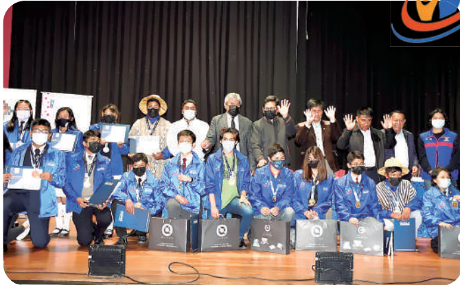
Autoridades del Ministerio de Educación premiaron con laptops y medallas de oro, plata y bronce, a los ganadores de la 10ª Olimpiada Científica Estudiantil Plurinacional.