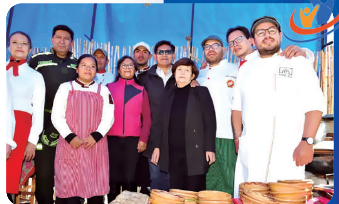
El titular de la cartera de Educación, Edgar Pary, visitó a la comunidad educativa del Instituto Tecnológico Superior Potosí.