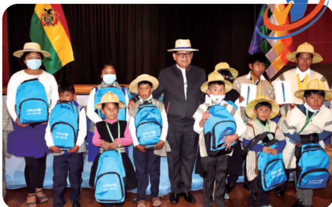
El Gobierno Nacional, a través del Ministerio de Educación, entregó tablets y material escolar a jóvenes, niñas y niños de la nación Uru.