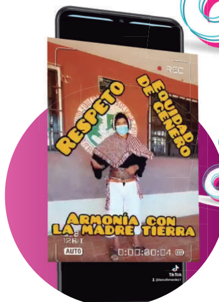
Damaso Roque de Chuquisaca.