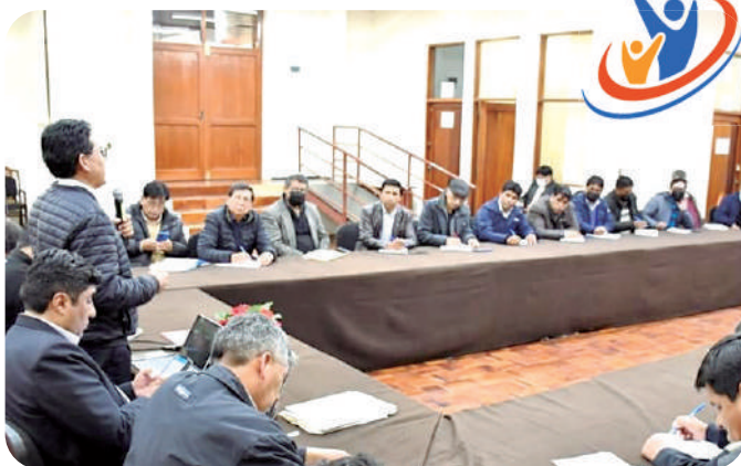
Ministro de Educación, Edgar Pary Chambi, visitó los departamentos de Chuquisaca, Potosí y Beni, donde se reunió con Directores Departamentales y Distritales de Educación.