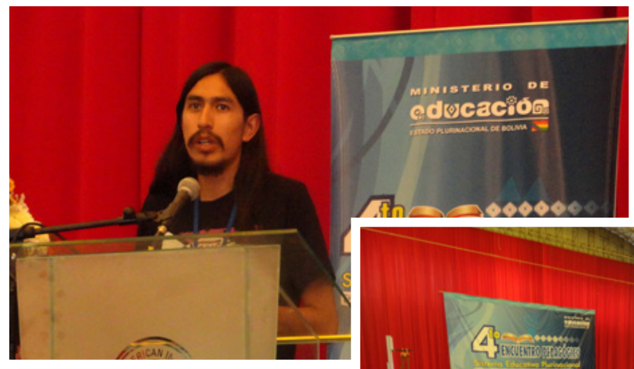
Participación activa en el 4to. Encuentro Pedagógico del Sistema Educativo Plurinacional.