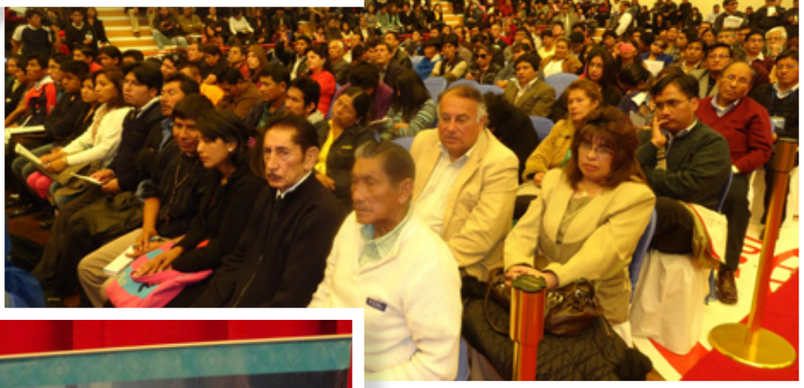
Masiva concurrencia de maestras y maestros y personas involucradas en el quehacer educativo del país participaron del 4to. Encuentro Pedagógico.