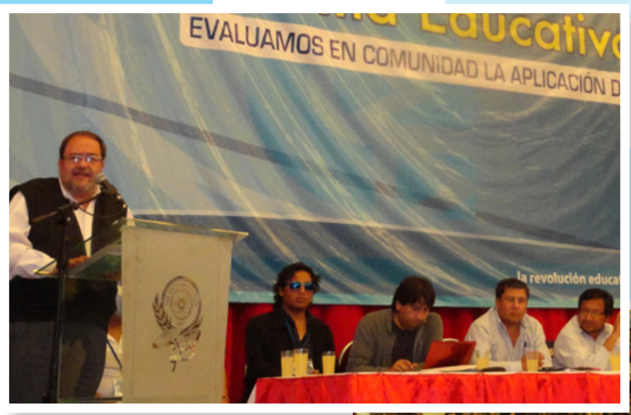
El Ministro de Educación, Roberto Aguilar Gómez, en la apertura del 4to. Encuentro Pedagógico realizado en la ciudad de La Paz.