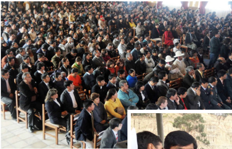
El 2do. Encuentro Pedagógico "Gran Acuerdo por la Educación" contó con la masiva participación de maestras y maestros del Sistema Educativo Plurinacional y de personas e instituciones vinculadas a la educación en Bolivia.